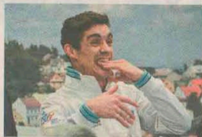
Javier Fernández se raduje z bodového přídělu. Právě se stal popáté mistrem Evropy.