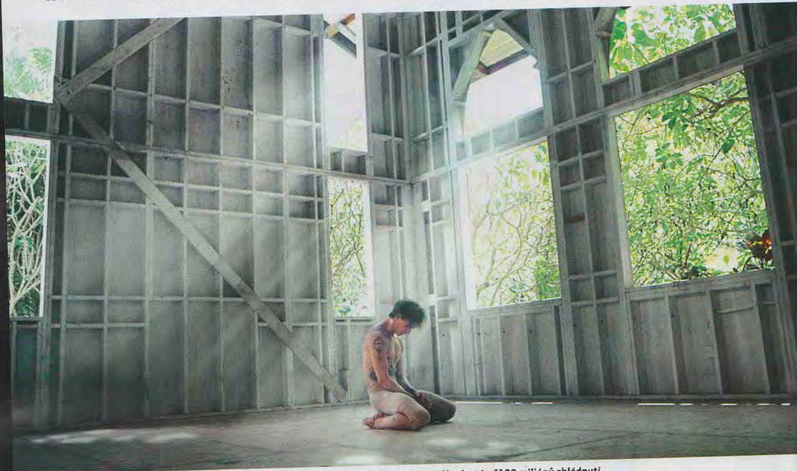
TAKE ME TO CHURCH Momentka z tanečního videa, které má za necelého dva a půl roku téměř 20 miliónů zhlédnutí

Na ruskou rozpínavost máme i my tady, v Česku, celkem čerstvé vzpomínky. Neuplynulo ještě