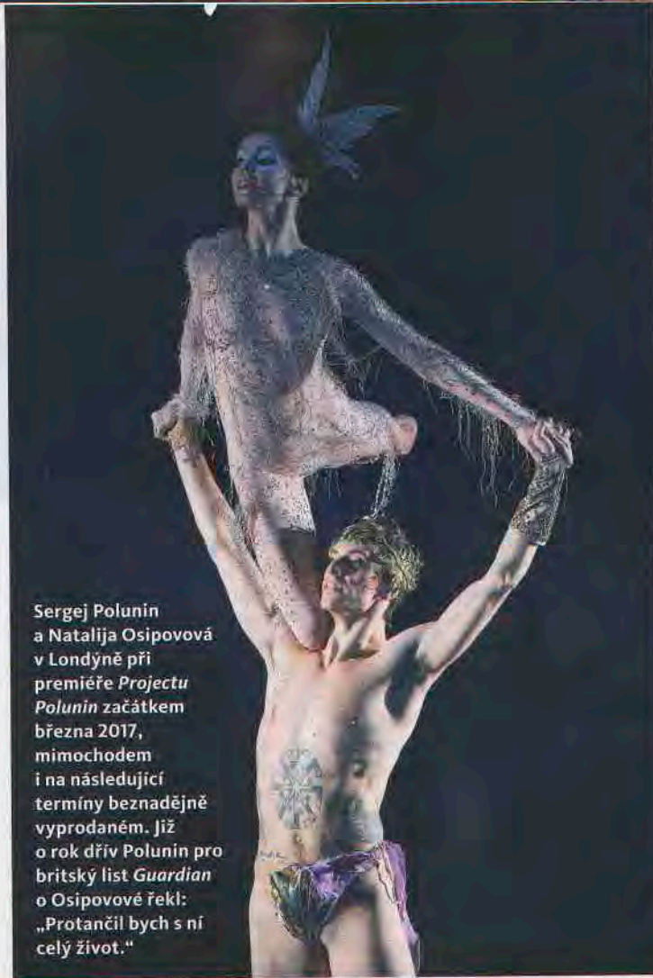
Sergej Polunin a Natalija Osipovová v Londýně při premiéře Projectu Polunin začátkem března 2017, mimochoodem i na následující termíny beznadějně vyprodaném. Jíž o rok dřív Polunin pro britský list Guardian o Osipovové řekl: „Protančil bych s ní celý život.“

Byl LaChapelle tou osobou, jež vám v Los Angeles otevřela dveře